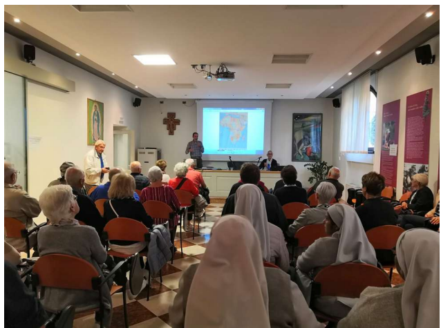
Fig.22: Momento pubblico di sensibilizzazione in cui il vicepresidente presenta le attività dell'Associazione in Karamoja