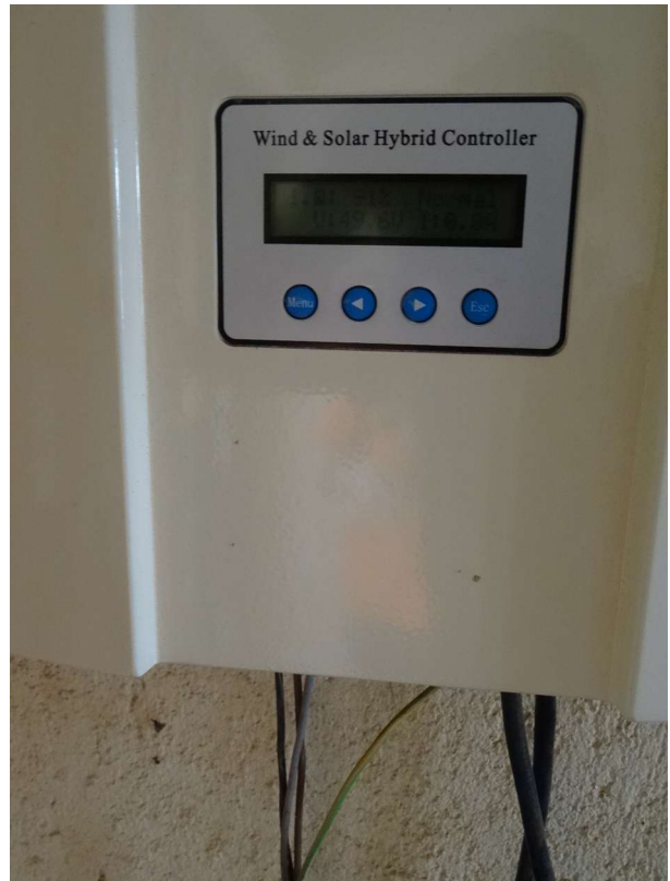
Fig.14: Il controller per il sistema ibrido di fornitura di energia solare ed eolica