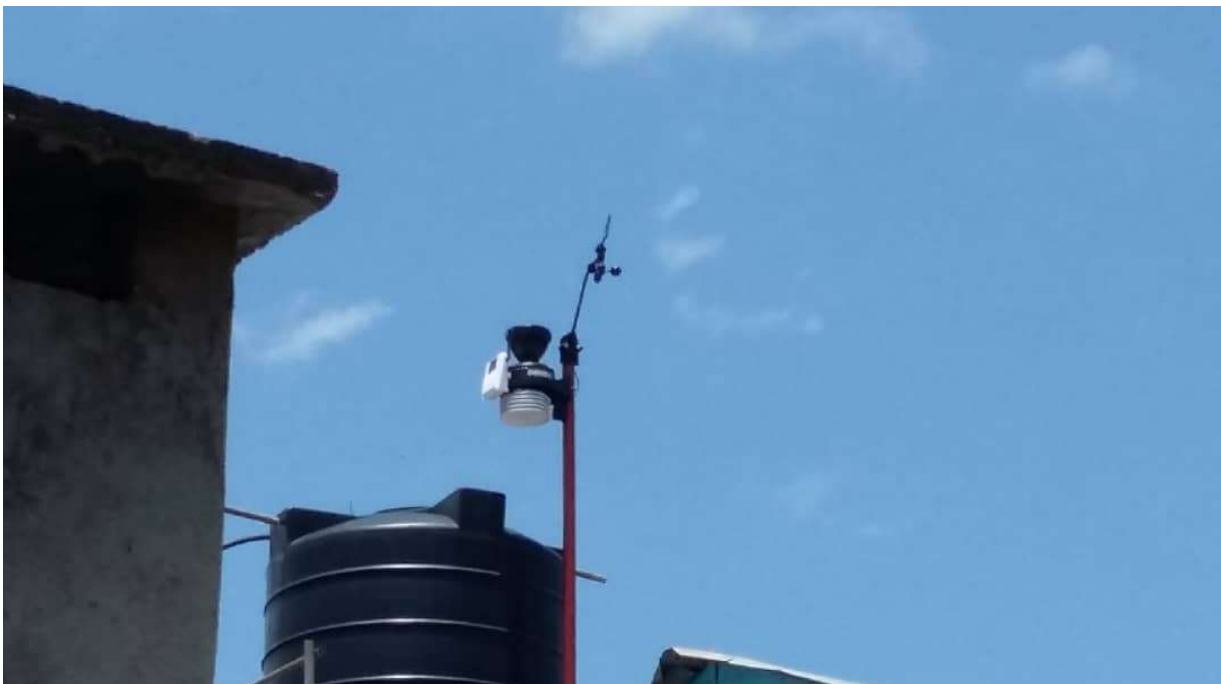
Fig.3: L'anemometro wireless installato sopra il tank dell'acqua a Kotido