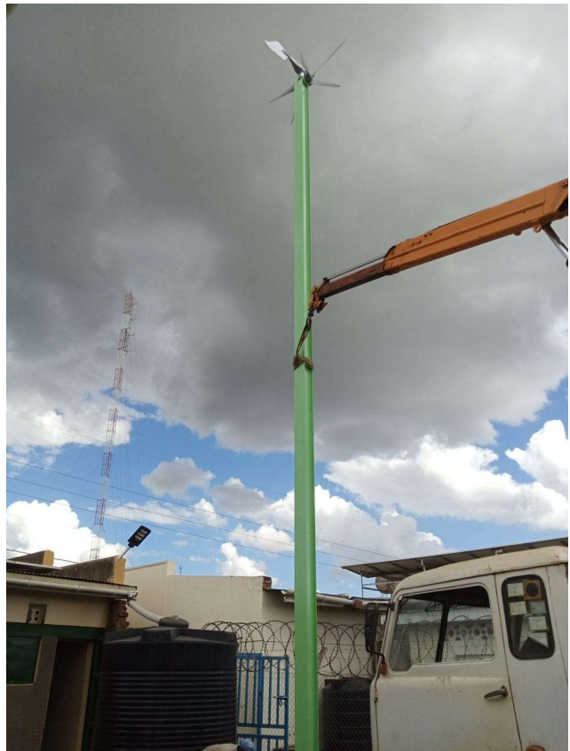
Fig.10: Operazioni di installazione delle turbine presso il piazzale interno alla radio