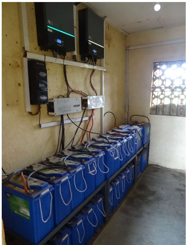
Fig.12: Il potenziamento del sistema ad isola con ulteriori batterie in serie e parallelo