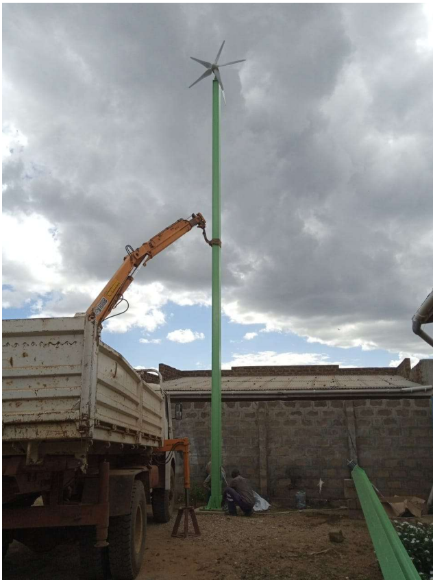
Fig.9: Operazioni di installazione delle turbine presso il piazzale interno alla radio