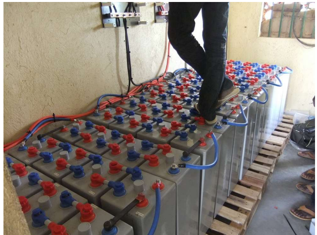
Fig.2: Il lavoro di installazione in serie e parallelo delle batterie per la realizzazione del sistema tampone di alimentazione dei dispositivi della radio