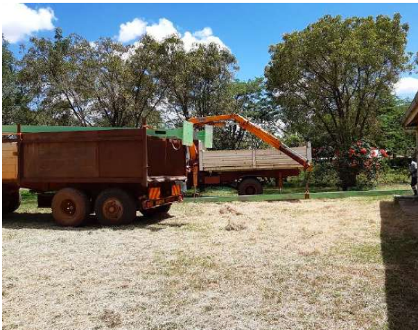
Fig.6: Lo scarico delle putrelle