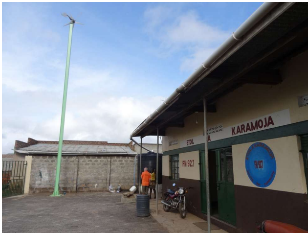
Fig.21: Sullo sfondo l'econo discute con un impiegato della radio