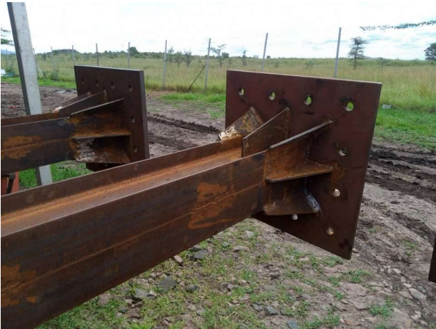
Fig.4: Particolari delle basi delle putrelle di sostegno in fase di costruzione