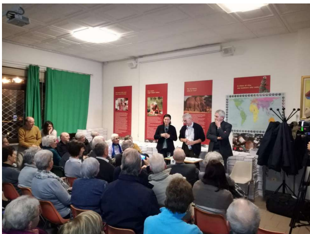
Fig.23: Momento pubblico di sensibilizzazione sulle attività dell'Associazione in Karamoja con la presidente che introduce il vescovo Filippi