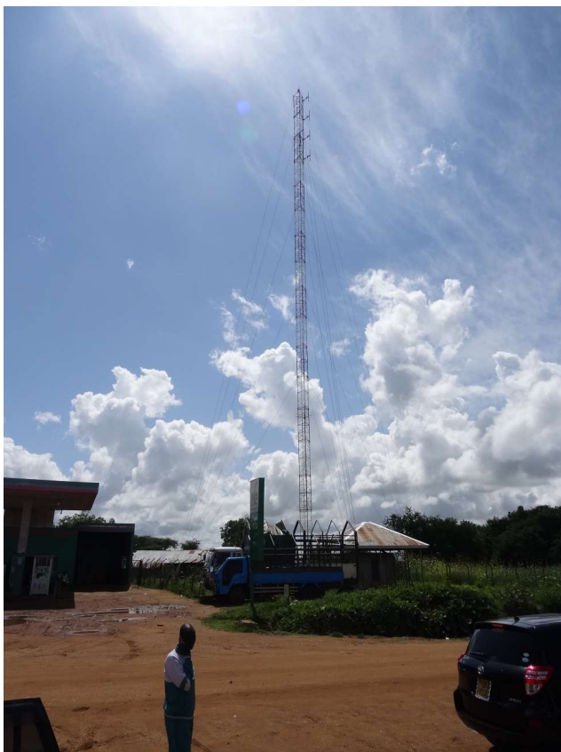
Fig.11: L'antenna di trasmissione dell'emittente radiofonica