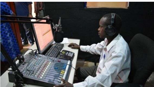
Fig.7: La consolle dello studio di registrazione della radio