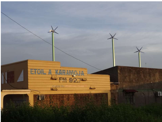
Fig.15: Veduta esterna degli uffici dell'emittente diocesana