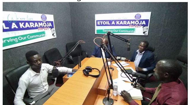
Fig.18: Funzionari ministeriali e amministrativi durante un programma radiofonico