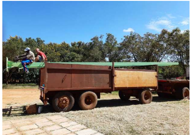
Fig.5: L'arrivo dei pali (putrelle) di sostegno delle turbine eoliche a Kotido