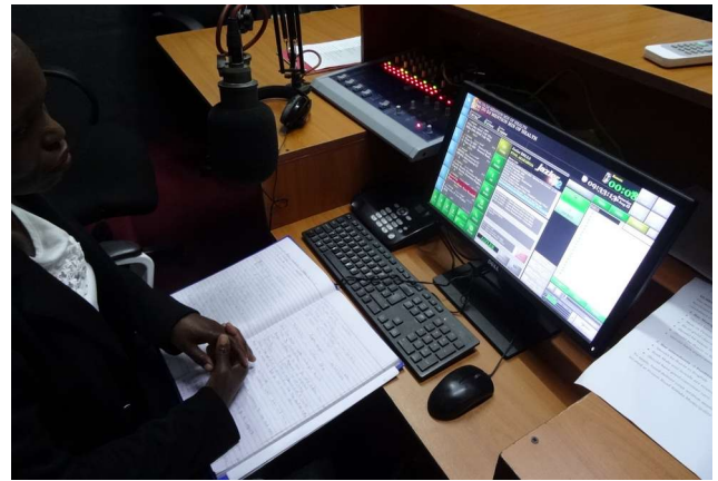
Fig.20: Il programma di gestione del palinsesto radiofonico