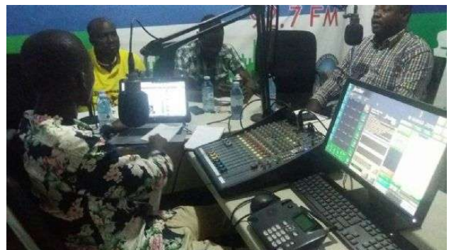
Fig.8: Dibattito in radio