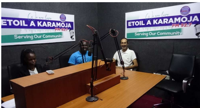
Fig.17: In visita allo studio di registrazione della radio "Etoil a Karamoja"