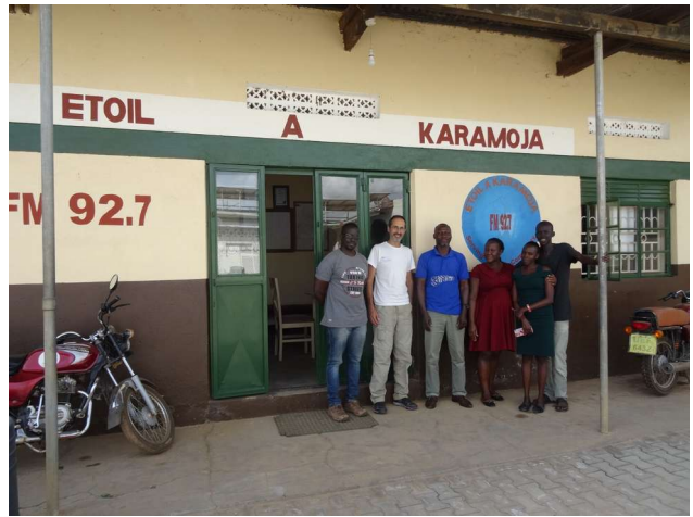
Fig.22: Foto ricordo con lo staff della radio