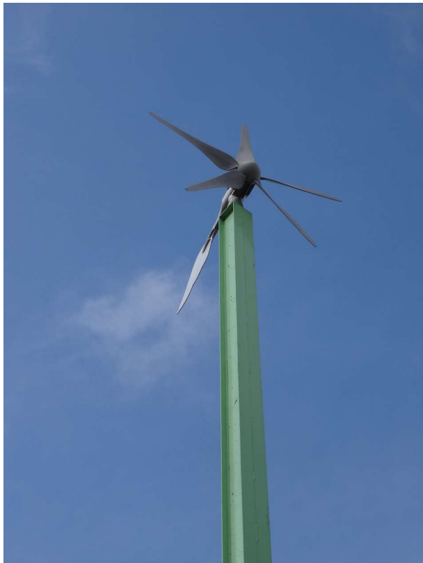
Fig.13: Particolare della turbina in cima al palo di sostegno