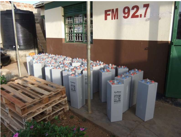
Fig.1: La serie di batterie appena scaricate davanti al locale dove è locata la radio “Voice of Karamoja”