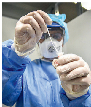
• Problemi anche con i tamponi

Analisi di un "naufragio". Tracciamenti saltati, positivi "fantasma" mai calcolati, confusione sui dati, scarsa organizzazione nei laboratori: tutte le criticità emerse che si potevano evitare > Luca Petermaier a pagina 14