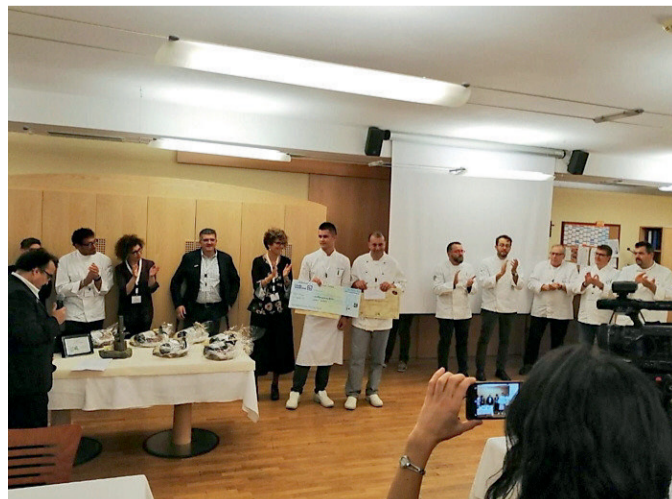
Il momento della premiazione degli allievi chef al concorso di Merano

distinguibili dello chef Mattias; da qui nasce la mission, che è quella di raccogliere fondi per finanziare borse di studio da assegnare a giovani e promettenti allievi delle scuole alberghiere. Per questo gli allievi partecipanti al concorso, provenienti dalle scuole lombarde, trentine e altoatesine, si sono ritrovati a Merano per realizzare un piatto creato da loro che aveva come ingrediente principale l'agnello. I giudici, che hanno valutato sia l'estetica, che il gusto e l'originalità della ricetta creata dai candidati, erano chef stellati membri dell'Associazione.