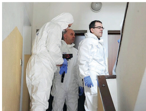
Gli agenti della scientifica nel palazzo dell'omicidio

CAOS SULLA SCENA DEL DELITTO DI VIA MACCANI